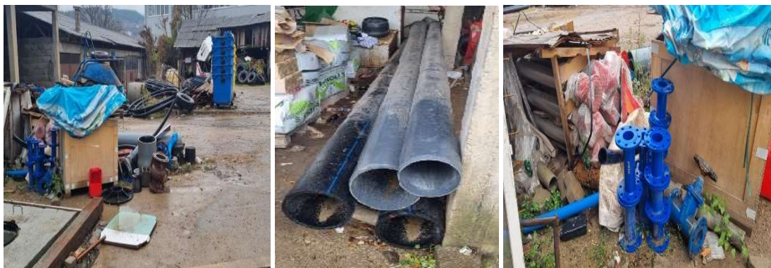
Слика бр.1 Суровини, материјали, резервни делови и ситен инвентар на залиха

Ваквиот начин на управување со залихите без тие да се одржуваат на оптимално ниво, создава ризик од нивно застарување, а неизвршената проценка на крајот на периодот на известување дали некои од залихите се безвредни т.е. дали сметководствената вредност нема да може во целост да се надомести влијае врз реално и објективно прикажување на вредноста на залихите во Билансот на состојба на ден 31.12.2023 година и на расходите и финансискиот резултат од работењето.