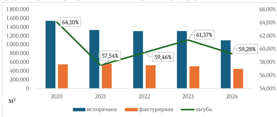
Графикон бр.3 Остварен физички обем на испорачана и фактурирана вода 2020 - 2024 година

Непреземањето мерки за минимизирање и отстранување на причините за техничките и комерцијалните загуби на вода преку активности за реална и објективна потрошувачка на вода за пиење, предизвикува нереална и необјективна состојба во процесот на фактурирање на испорачаната количина на вода за пиење и има за ефект помалку остварени приходи на претпријатието, помалку пресметан ДДВ и помалку пресметан надоместок за вода кои претставуваат приходи на Буџетот на државата.