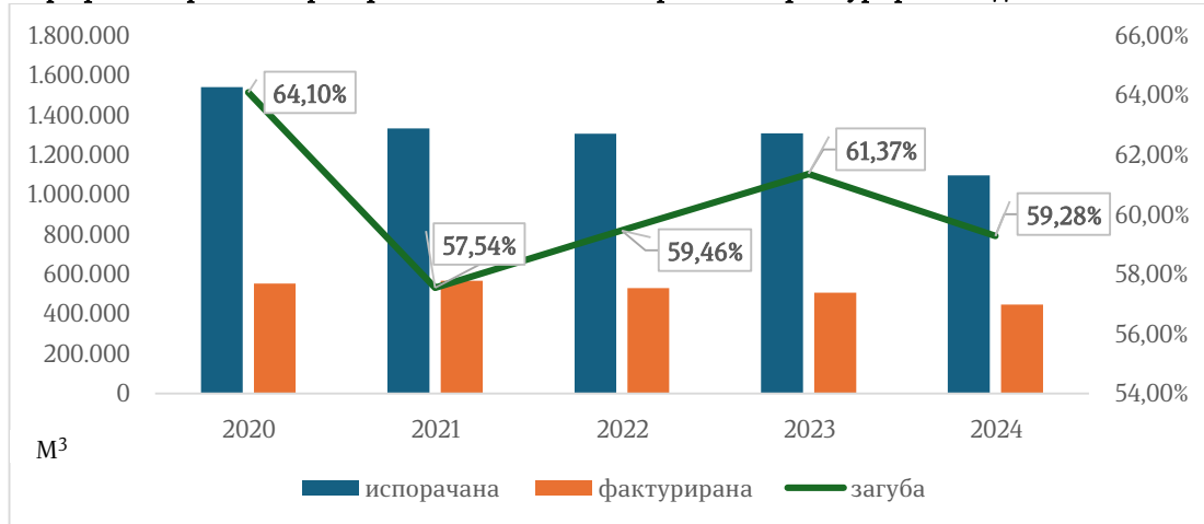
Графикон бр.3 Остварен физички обем на испорачана и фактурирана вода 2020 - 2024 година

Непреземањето мерки за минимизирање и отстранување на причините за техничките и комерцијалните загуби на вода преку активности за реална и објективна потрошувачка на вода за пиење, предизвикува нереална и необјективна состојба во процесот на фактурирање на испорачаната количина на вода за пиење и има за ефект помалку остварени приходи на претпријатието, помалку пресметан ДДВ и помалку пресметан надоместок за вода кои претставуваат приходи на Буџетот на државата.