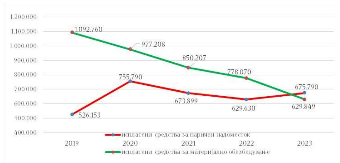
Исплата на средства за паричен надоместок за периодот од 2019-2023 година

За исплата на средства за паричен надоместок во случај на невработеност во 2023 година исплатени се средства во вкупен износ од 1.305.639 илјади денари односно 21 милион евра, истите бележат тренд на намалување во однос на 2022 година, односно исплатени се помалку средства во износ од 102.071 илјада денари.