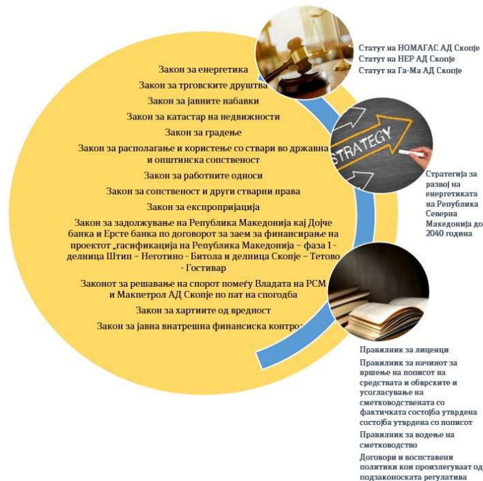
Графикон број 1 – Правна рамка

2.4. Основни методи кои се применети во ревизијата на усогласеност за обезбедување на доволно релевантни докази се: проучување на законска и подзаконска