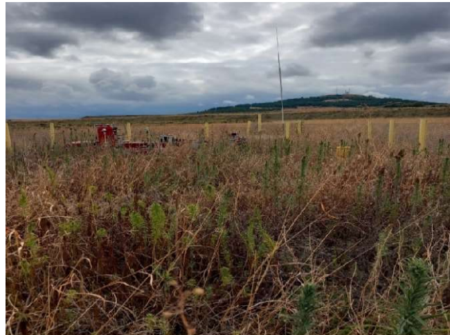
Слика број 2 – ЛОТ 1 – 36 увид на терен на состојбата на Блок станица Неготино

Со извршениот теренски увид утврдивме дека дел од ГМРС и Блок станиците се во неодржувана и запустена состојба и потребни се активности за одржување, како и дека истите не се обезбедени со физички или видео надзор, што може да влијае на ангажирање на дополнителни финансиски средства при нивното пуштање во употреба. Наведените состојби не се во согласност со член 11 од Закон за користење и располагање со стварите во државна