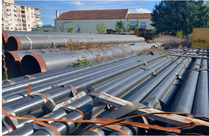
Слика број 6 - Набавени цевки за изградба на Дистрибутивната мрежа за пренос на природен гас и затварање на прстенот околу градот Скопје на отворен складишен простор

Проектот не се реализирал иако планираната изградбата била во координација со надлежните сектори од Градот Скопје, што се потврдува и со започнатата постапка за одобрување на инфраструктурен проект од страна на ГА-МА на ден 14.06.2022 година 72 . Одговорот за проектот од Комисијата за урбанизам на Градот Скопје, добиен е во мај 2023 година 73 , со низа забелешки по кои треба да се постапи и повторно да го достави. Надлежните лица како причина за големата набавка на цевките и резервните делови за