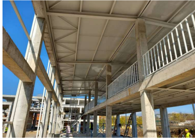
Слика број - 5 Нов магацински, деловен и складишен простор на НОМАГАС во с. Ржаничино

Истакнуваме дека во тек е изградбата на нови магацински, деловни и складишни простории, кои се започнати од страна на ГА-МА и продолжени од НОМАГАС со вкупна вредност од 153.053 илјади денари и реализација, заклучно со октомври 2023 година, од 102.089 илјади денари или 67%. Овој простор треба да се пушти во употреба во март 2024 година, а според очекувањата на надлежните вработени, со неговата изградба треба да се намалат проблемите со чувањето и издавањето на залихите во иднина.