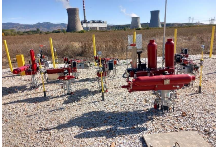
Слика број 3 - Блок станица 11а/РЕК Битола која е дел од Делница ЛОТ2