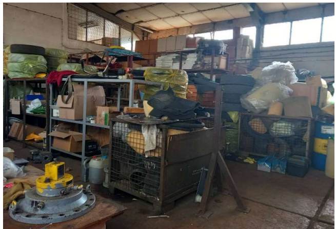
Слика број 4 - Затворен магацински простор во населба Маџари