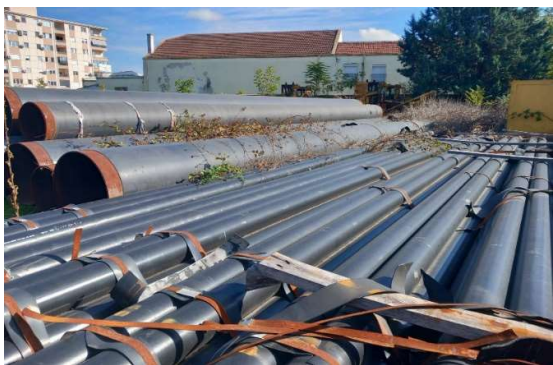
Цевки за изградба на дистрибутивната мрежа за пренос на природен гас и затварање на прстенот околу Скопје

Набавени се значајна вредност на резервни делови и материјали за завршување на гасоводниот прстен околу градот Скопје, кој поради недоволна координација со надлежните служби на Град Скопје, не е завршен и на тоа место е изградена нова сообраќајница, поради што во иднина за да се затвори гасоводниот прстен околу градот ќе треба да се прават дополнителни активности и расходи.