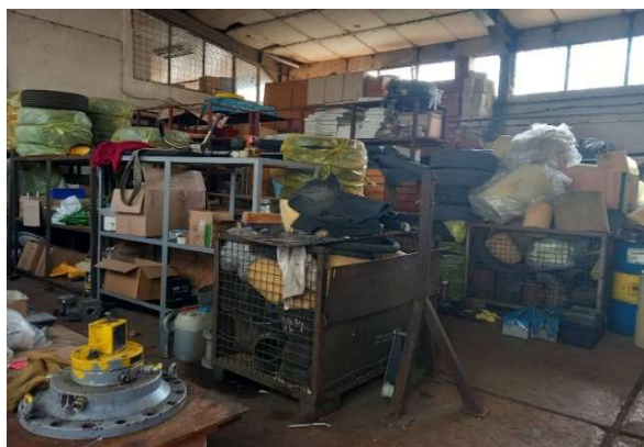
Затворен магацински простор во НОМАГАС

За делниците кои не се изградени, а за кои се набавени материјали и резервни делови е утврдено несоодветно управување со нивната залиха, што претставува ризик од нерационално трошење на јавни средства. Имено, ревизорите утврдиле постоење на залихи на материјали и резервни делови, со вкупна вредност од приближно 1,6 милиони евра , кои се набавена пред 2019 година и истите не се користат, со што се доведува во прашање потребата од нивна набавка како и можноста истите да бидат застарени и неупотребливи.