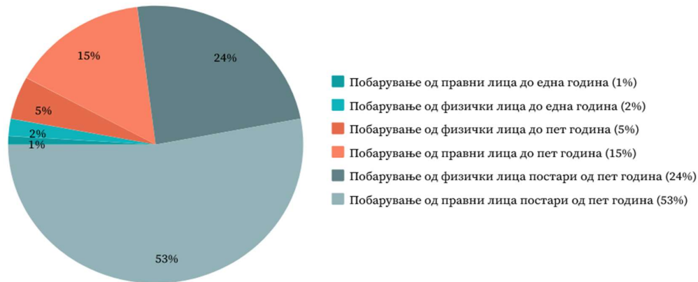
Графикон бр.1 Структура на побарувањата на 31.12.2022 година

Со извршената анализа на побарувањата, старосната структура, како и преземените мерки за нивна наплата, ги утврдивме следниве состојби: