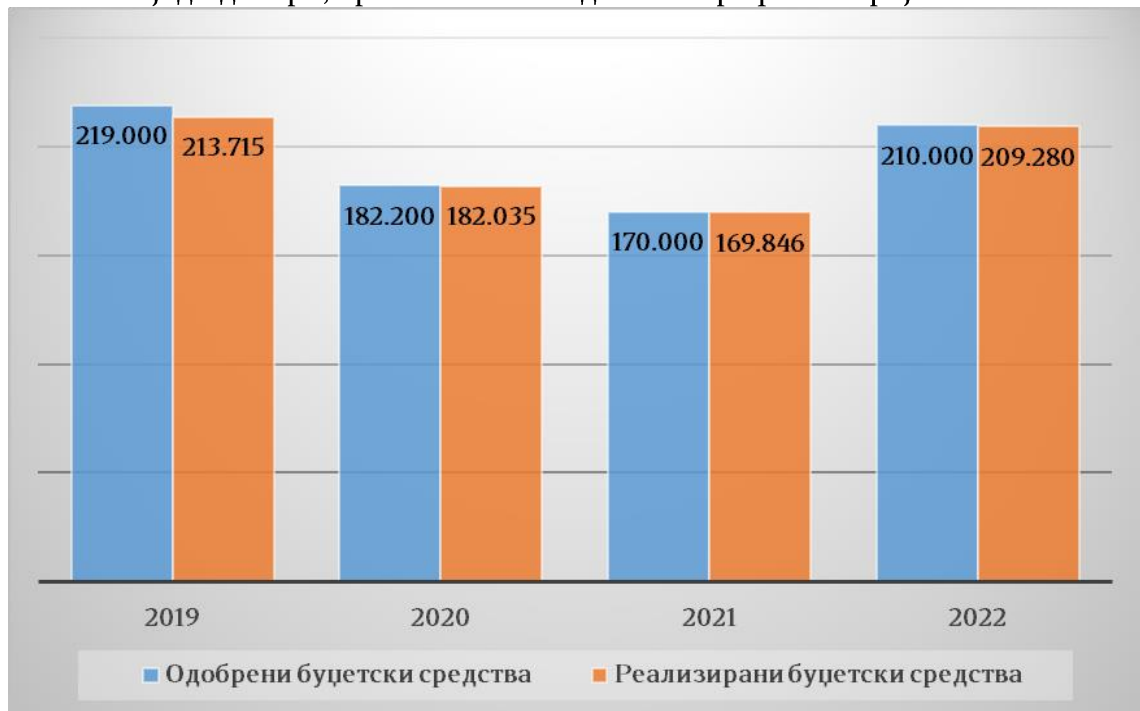
Графикон број 1: Одобрени и реализирани средства по подпрограма БА-Изградба и реконструкција на објекти и инфраструктура

За период од 2019 до 2022 година одобрени се буџетски средства во износ од 781.200 илјади денари, прикажани по години во Графикон број 1: