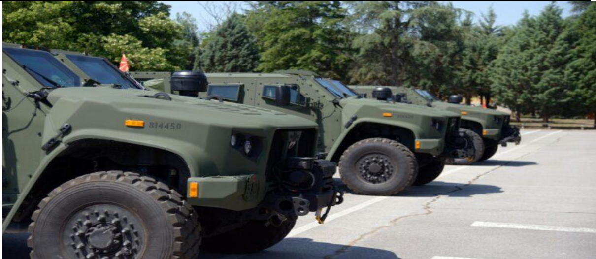
Слика број 1 : Нови оклопни возила од типот JLTV

Буџетот за одбраната е во постојан пораст и во 2023 година истиот е во вкупен износ од 275 милиони евра односно 1,85% од Бруто домашниот производ, од кои една третина се алоцираат за модернизација и опремување на Армијата.