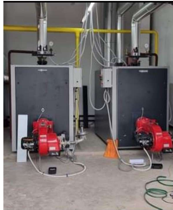
Гасификација на Општа болница Куманово