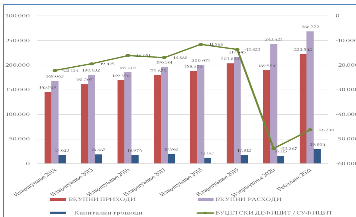
Графикон бр.1: Обработени податоци објавени на веб страната на Министерство за финансии од Сектор Трезор за приходи, расходи, капитални расходи и буџетски дефицит во Буџетот на РСМ за период 2014-2020.

Во предлог Законот за буџети кој е во собраниска процедура, предвидени се фискални правила и предвидено е формирање на Фискален Совет, како независно тело кое прави анализи и дава мислење за фискалната политика пред Собранието на РСМ.