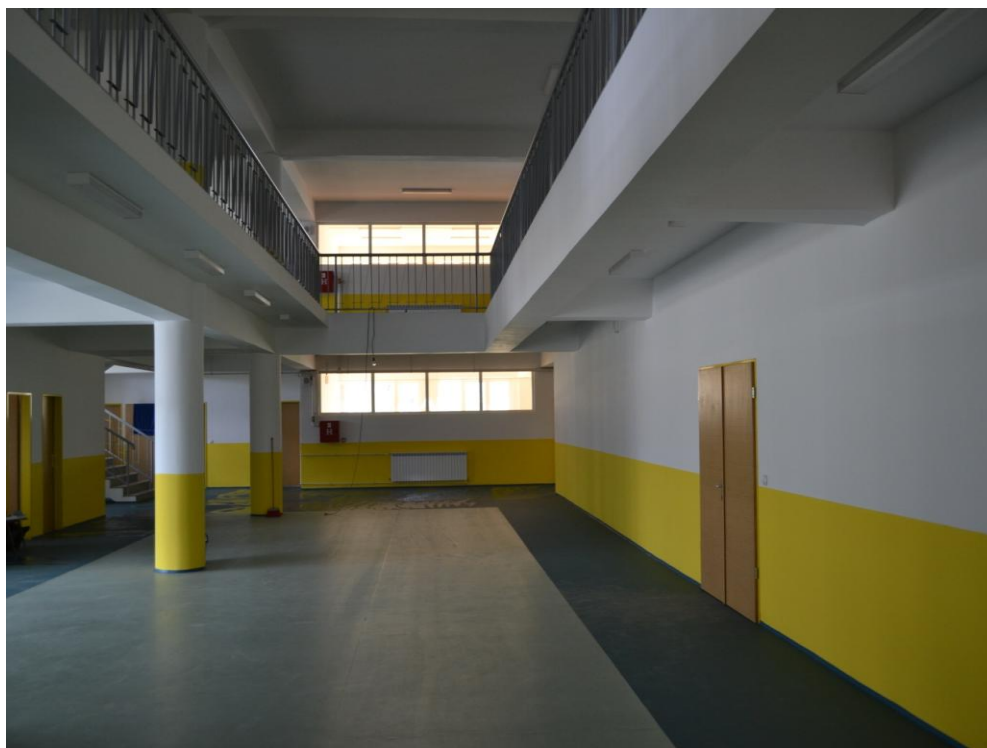
Слика 3.1. Внатрешен дел во ново средно училиште во општина Шуто Оризари

Од наведената табела за процентот на реализација на програмите може да се утврди дека во одредени години процентот на реализација на програмите е мал од причини што се јавуваат проблеми при реализацијата на договорите за градба со економските оператори кои неквалитетно и ненавремено ги извршуваат договорите за изградба, раскинување на договорите, активирање на банкарски гаранции и избор на нови економски оператори кои ја продолжуваат изградбата на средните училишта. Надлежните лица задолжени за реализација постапувале согласно законската регулатива и договорите.