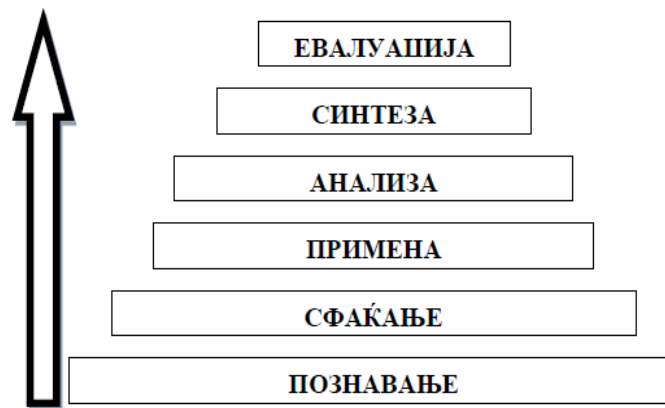
Графички приказ на когнитивниот домен на Блумовата таксономија

прави со помош на прашања кои се распоредени според тежинското ниво на скалата на Блум. 22